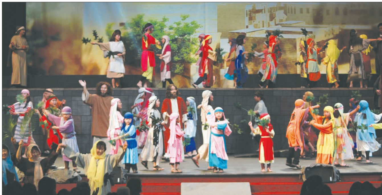
주님께서 십자가 지시기 직전 예루살렘에 입성하시는 장면. 어린이 배우들이 종려나무를 흔들며 주님의 입성을 맞이하는 장면은 특히 인상적이었다.