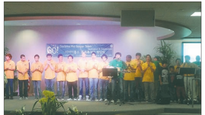
축구선교단 그린엔젤스가 프로축구팀 디사이플스를 창단했다.

7년 전 축구를 통해 복음을 전하고자 창립된 그린엔젤스는 한인 사회 최초로 프로축구팀을 창단하며 일단 세미 프로리그인 유나이티드 프리미어 사커 리그에서 경기를 펼 계획이다. 현재 선수는 10대 후반에서 20대 후반까지 총 20여명으로 구성돼 있으며 풀러턴칼리지 운동장을 홈구장으로 한다. 한편, 김 대표는 연세대 대표팀 출신이며 미국 세미 프로팀에서 뛰 경력을 갖고 있다. OC한인축구