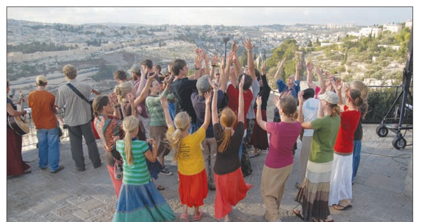
감람산에서 메시아니즘이 찬양하는 모습, 다큐멘터리 <회복> 중