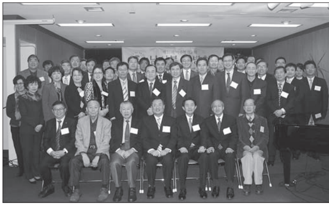
남서부지방회를 마치고 기념촬영

13일 오후 4시 필그림교회에서 기독교미주성결교회 남서부지방회 제33차 지방회가 열렸다. 개회예배는 김창수 목사(직전 부회장, 필그림교회)의 사회로 시작돼 이하우 장로(직전장로부회장, 유니온교회)가 기도했고 윤석형 목사(직전회장, 산샘교회)가 출 5:22-6:1을 주제로 “건달”이란 제목으로 설교했다.