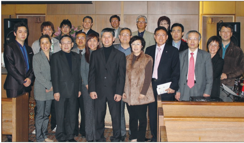
이날 세미나에는 교계 지도자들이 다수 참석해 동성애 문제에 대한 비상한 관심을 드러냈다.