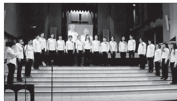
지난해 열린 남가주UMC 찬양의 밤

오는 3월 4일 오후 4시 30분 월서연합감리교회(정영희 목사)에서 남가주연합감리교여성선교회 연합회(회장 손미애 권사)에서 주관하는 제23회 찬양의 밤이 개최된다. LA지부 부회장 최미란 권사는 "이 행사는 매해 20여개 교회에서 1300여명이 참여하는 대규모 행사"라며 "경쟁보다는 모두 한 목소리로 하나님께 영광을 올