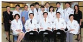
20여명의 전문 의료진과 스텝