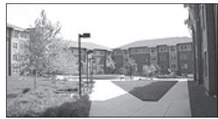
현재 조지메이슨대학 내에는 모스크 건립안이 추진 중이다. 이외 조지타운대학교와 하버드대학교 등에도 2천만불 이상의 기액이 투자, 친이슬람 연구센터가 세워졌다.