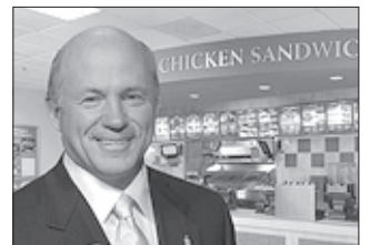
칙필레의 회장 덴 캐시

성경적 운영 방식으로 잘 알려진 크리스천 기업인 칙필레는 1967년 트루엣 캐시에 의해 설립된 현재는 그의 아들 덴 캐시가 이어 받아 ‘신실한 정치가가 되어 하