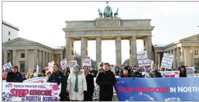
마지막날 이들은 베를린으로 이동해 독일 통일의 상징인 브란덴부르크 문 앞에서 평화적으로 시위했다.

지만, 하나님은 나같이 약한 자를 들어 사용하신다"며 "나는 정치적 인 목적도 없고, 명예가 필요한 것도 아니다"고 말했다.