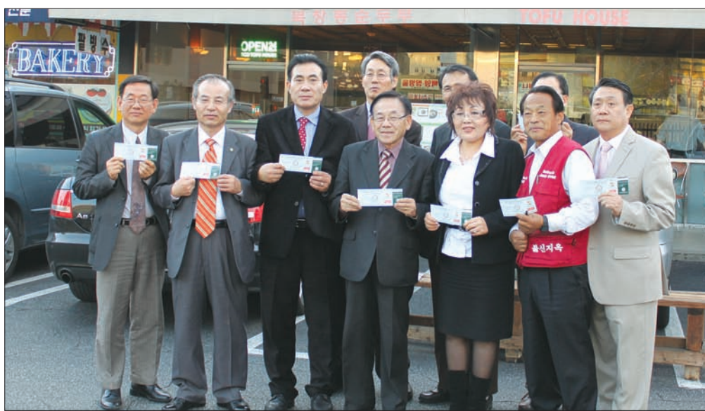
목사회 임원들이 기독교회관 건립과 관련해 남가주 교계의 적극적인 후원을 당부하고 있다.