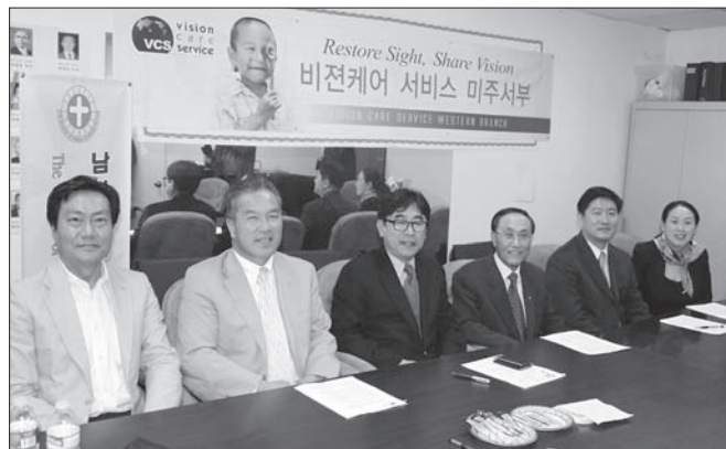
의료선교단체 비전케어서비스가 남가주 한인회 위해 무료 백내장 수술을 진행한다.

하나님의 사랑을 전하는 세계적인 의료선교단체 비전케어서비스(이하 VCS)는 제 3세계를 찾아가 무료개안수술을 통해 잃어버린 시력을 되찾아 주는 국제구호