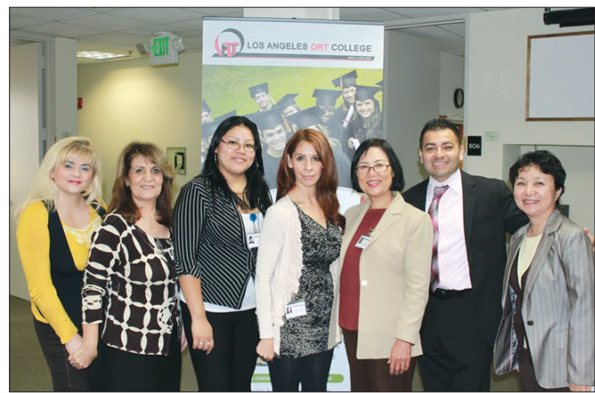
LA ORT의 교직원들. LA ORT는 1백년 이상의 역사와 전통을 자랑하는 남가주 최대의 직업 대학으로 꼽힌다.

영어는 물론 다양한 직업 교육을 무료로 받을 뿐 아니라 졸업 후 높은 취업률을 자랑하는 학교가 있다. LA ORT College(The Organization for Educational Resources and Technological Training)다. 이곳은 1880년에 설립돼 장구한 역사와 전통을 자랑한다.